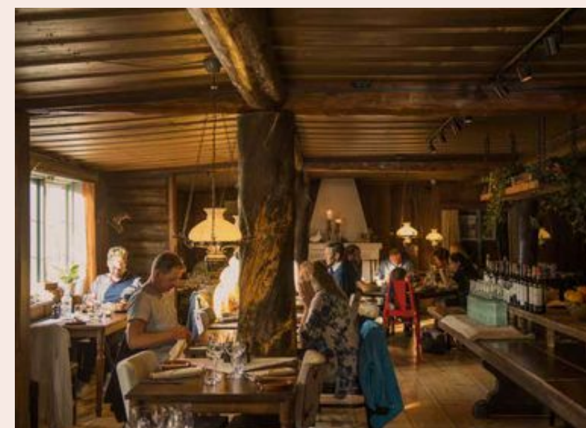
KÄNSLAN VIKTIG. Gammelgården i Sälen är verksamheten som vänder sig till fjällbesökare som önskar lugn och ro. Gården är ursprungligen från 1640.

■ ”När man kommer upp till vissa volymer går det absolut att ha bra lönsamhet inom restauranger. Men det gäller att driva det smart och jaga synergier i alla led. Av min totala omsättning är cirka 70 procent restaurang.”