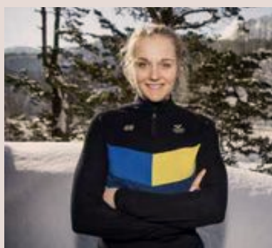
OLYMPISK GULDMEDALJÖR. Stina Nilsson, längdåkare.