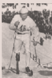
Sixten Jernberg, skidlegend.